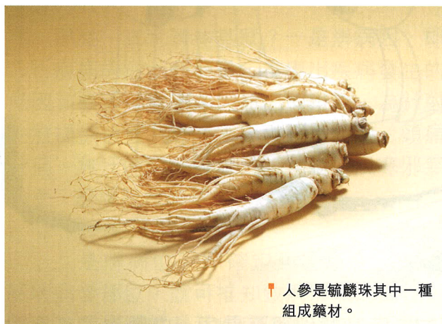
↑ 人參是毓麟珠其中一種組成藥材。

氣藥人參、白術、茯苓、炙甘草，即四君子湯，能培補脾胃，具有健脾益氣的功效，即能提升人體的能量代謝和增強機體抵抗力；補血藥熟地黃、白芍、當歸、川芎，即四物湯，能補血調經，有促進血紅蛋白和紅細胞生成，及增強免疫功能的作用；再加補腎助陽藥菟絲子（補腎固精，安胎）、杜仲（補肝腎，強筋骨，安胎）、鹿角霜（溫補肝腎、強筋骨、活血消腫）、川椒（溫中止痛）皆能溫補肝腎。諸藥相合，既溫養先天之腎氣以生精，又培補後天之脾胃以生血，精血充足，達致暖宮助孕。以下的個案，是運用毓麟珠調理腎陽虛不孕患者的效果，與大家分享。